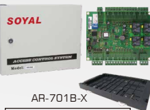
雙門唯根控制器/ 唯根轉RS485轉換器 AR-716-E02